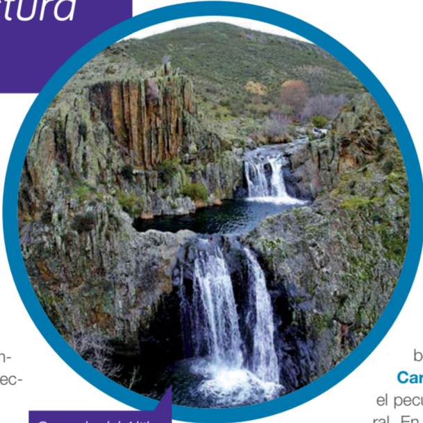
Cascada del Aljibe, Roblelacasa

La sierra noroccidental de Guadalajara, entre las vertientes meridionales de Somosierra y de la Sierra de Ayllón, atesora uno de los conjuntos más impresionantes de la arquitectura popular europea: la Arquitectura Negra, sorprendente enclave que se encuentra en período de declaración por la Unesco como Patrimonio de la Humanidad , dado su extraordinario valor etnográfico, arquitectónico y paisajístico.