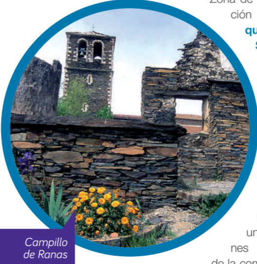
Campillo de Ranas

El inicio de la ruta lo marcamos en Tamajón , conocido popularmente como la puerta de la Arquitectura Negra. Destaca la Ermita de Nuestra Señora de los Enebrales, del siglo XVIII. Cuenta dentro de su arquitectura civil con el Palacio de los Mendoza, mientras los parajes de enebros y peñascos erosionados por la acción del agua y el viento nos transportan a la llamada Ciudad Encantada, espacio idóneo para el esparcimiento en contacto con la naturaleza.