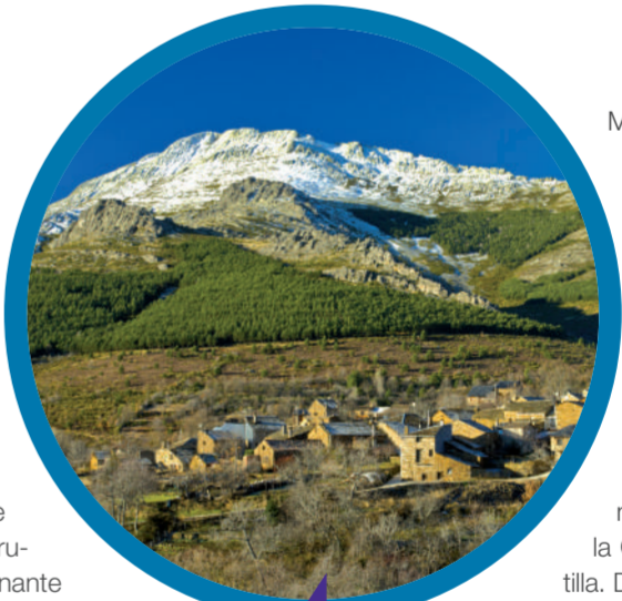
Valverde de los Arroyos

María Magdalena es un símbolo de la comarca. Dejando atrás Roblelengu , nos fijamos en el paraje denominado Valle de Robles, llegando poco después al pueblo que constituye uno de los referentes de la zona, Majaerayo , donde diversas sendas nos conducen a la cima del Ocejón . En el camino se puede recrear la vista con la Cascada del Arroyo de la Matilla. Deambular entre el caserío permite admirar un amplio muestrario de la arquitectura negra en las construcciones. En cuanto a las fiestas, sin duda hay que detenerse aquí si se llega en el mes de enero para disfrutar de la del Santo Niño .